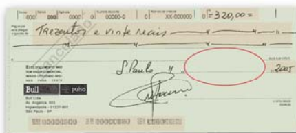
Verificación de los campos obligatorios

Así que la ley fuere reglamentada, las instituciones financieras empezarán la implementación del truncamiento de documentos. Con gran éxito, la A2iA fue una de las primeras empresas a crear tecnología especializada para el truncamiento de documentos en la compensación bancaria.