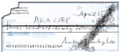
Análisis de calidad