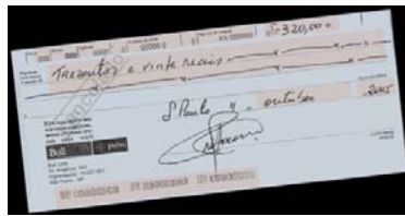
Detección de skew